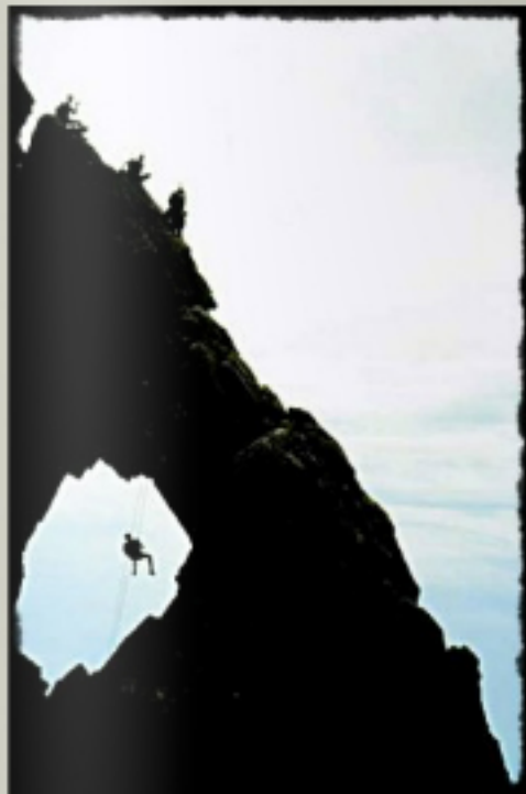
Cuarta etapa: El inicio fue la misma noche a las 22h, con una sección de trail nocturno, donde la

lluvia, el frío, el viento, los fuertes desniveles fueron los protagonistas de la sección. Varios equipos llegaron más allá de las 7 de la mañana del día siguiente a una estación de esquí en más de 1700 m. La segunda sección de la cuarta etapa salía del puerto de Bavella y daba la vuelta a las Agujas de Bavella siguiendo el mítico GR20, conocido como el más duro del mundo. Los equipos tuvieron que superar un trekking exigente con un fuerte desnivel. En este punto de la carrera se empezaban a ver las caras de cansancio y las secuelas de una noche muy dura donde los primeros equipos sólo han dormido 3 horas. A destacar que los dos primeros equipos, Raid del Segre-Borges Trail i el equipo Militar Francés GMPA entraron en meta al ensamble, imponiendo un fuerte ritmo desde la salida y donde los equipos perseguidores entraron a más de 45 minutos de diferencia. Le siguió una sección decisiva para el equipo catalán, donde pudo recortar más de 22 minutos con la bicicleta de montaña, con un tramo de descenso, donde la clave estuvo la técnica de descenso y la orientación. Al final de esta etapa el equipo Raid del segre-Borges Trail se colocó el maillot amarillo al GMPA y se colocaba líder con 5 minutos de diferencia.